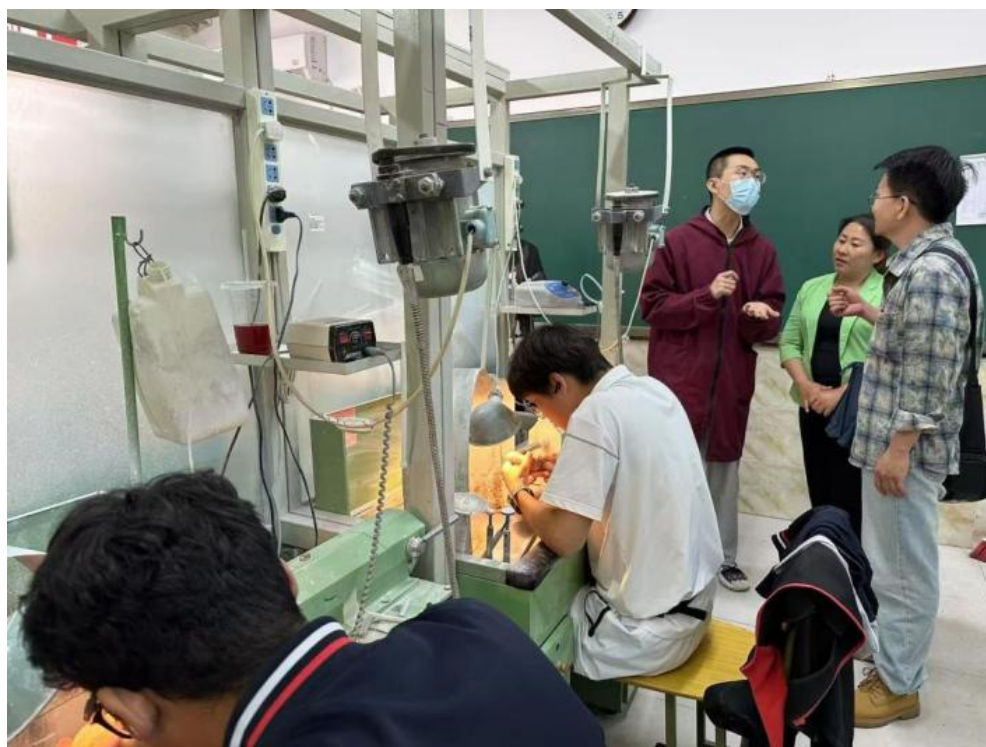
图 5-2 玉雕专业教师在北京院校实训室观摩交流现场

为主动融入“京蒙协作”发展格局，深化校际合作与专业内涵建设，文化旅游系玉雕专业教师团队赴北京开展专项调研，先后访问北京工艺美术学院与北京轻工技师学院天桥校区。团队深入两校实训教学一线，重点考察了玉雕数字化加工设备、传统工艺实训流程及“科技+工艺”融合的教学实践。北京工艺美术学院在教学中突出技术创新与效率提升，北京轻工技师学院则彰显出深厚的技艺传承与严谨的教学体系，为我校玉雕专业建设提供了宝贵经验。双方围绕模块化课程构建、项目式教学实施、师资共育等主题展开研讨，并在课程共建、教材开发、师生互访、技能竞赛联办、“大师课堂”开设等方面达成多项合作意向，为后续持续深入的校际协同奠定了坚实基础。调研推动了文化旅游系推动玉雕专业高质量发展、对接行业前沿、服务地方产业升级，为区域工艺美术行业发展注入新的活力（图 5-2）。