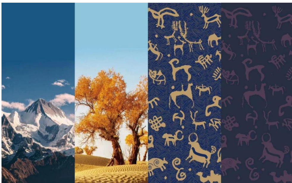
图 4-6 文化旅游系创作“善”文化文创丝巾