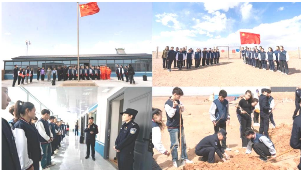
图 4-4 “携手北疆楷模 共建北疆文化”阿职院师生走进大漠边关

“两弹一星”精神志愿宣讲团立足阿拉善“最美草场为航天”“神州起落在吾乡”的独特禀赋传承红色基因，宣讲团由师生骨干组成。前期赴 051 基地研学后，宣讲团在暑期“三下乡”实践与校内外巡讲中，通过“戈壁滩上的航天梦”“我的家乡额济纳”等故事，讲述“两弹一星”研制的攻坚克难事迹，普及核能知识；以互动问答、情景模拟等形式，让青少年感受核工业成就，体会“两弹一星”精神与阿拉善人民奉献精神的契合。截至目前，宣讲累计覆盖约 800 人次，激发了青少年民族自豪感与科技报国使命感(图 4-4)