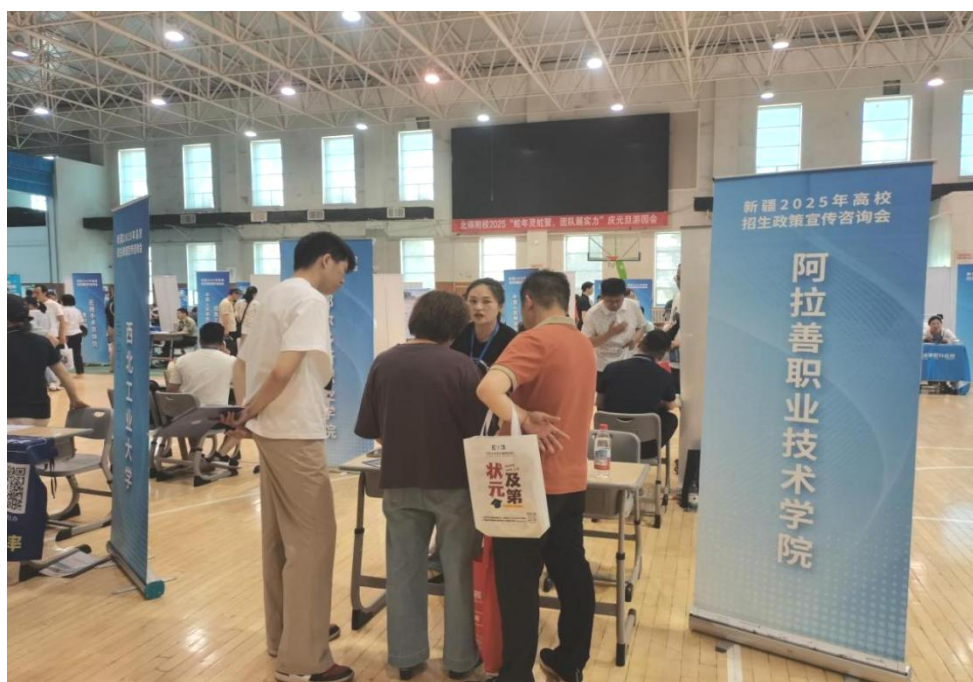
图 2-6 2025 年学院招生宣传现场

2025 年，自治区高考综合改革全面落地，对职业教育发展改革带来了新的机遇和挑战。阿拉善职业技术学院主动适应改革新要求，严格执行国家及自治区“阳光招生”政策，坚守“公平、公正、公开”原则，立足实际，周密部署，精准施策，创新宣传服务模式，实现了招生工作新突破。一是健全招生机制，组建了院系联动的招生工作机构，构建了“线上+线下”“分片+入校”等多元宣传机制。二是明确责任分工，实施分片包联机制，区内组织 10 批次宣介团队，深入全区各盟市旗县区，入校入班招生宣传；区外组织 7 支精干队伍，赴 12 个区外生源省市进行点对点招生宣传。三是抓好责任落实，全体成员积极主动作为，不折不扣完成招生任务，取得了显著成效，全面完成招生计划，招生规模达到 2553 人，创历史新高。同时，生源质量大幅提升，在高职（专科）批次录取中，多个专业报考热度空前，特别是电气自动化技术、机电一体化技术等 12 个热门专业的部分科类录取分数超越了自治区本科控制线，充分体现了职业教育强国的就业吸引力和社会认可度（图 2-6）。