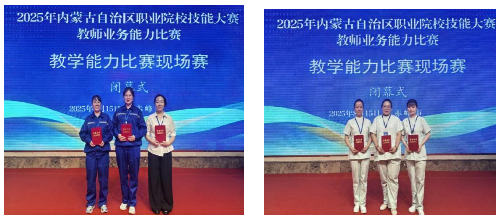
图 2-2 教师 2025 年在全区教师教学能力大赛中两支队伍荣获一等奖

教师队伍是职业教育高质量发展的第一资源。2025 年，学院深入实施“强师战略”，通过精准施策在课程建设、教学竞赛、科研创新与赛教融合领域实现多点突破，为学院内涵发展筑牢人才根基。一是聚焦课程建设，夯实育人主阵地：学院以课程改革为核心，推动教师将行业新标准、新技术嵌入课堂，打造数字化教学资源体系。本年度成功获批自治区级在线精品课程 4 门、一流核心课程 1 门、职业能力培训课程 4 门，标志着学院在课程内涵升级与数字化转型上迈出关键一步。教师主动探索混合式教学模式，构建学生认可的优质“金课”。二是锤炼教学能力，在竞赛舞台显锋芒：以教学能力大赛为抓手，学院通过团队组建、集体磨课实现“以赛促教、以赛促改”。今年在自治区教学能力大赛中斩获历史性佳绩：中职组获一等奖 2 项，高职组获三等奖 3 项，中职赛道的亮眼表现，充分彰显教师扎实的教学功底、先进教育理念与卓越团队协作能力。三是激发科研活力，驱动内涵新突破：坚持科研反哺教学，学院完善激励制度、搭建科研平台激活教师创新潜能。全年申报各级科研项目 48 项，立项省级 4 项、地厅级 4 项、院级 10 项，实现自治区自然科学基金青年项目“零的突破”。这一突破挖掘了青年教师科研潜力，成为教师专业成长与学院内涵提升的新引擎。四是深化赛教融合，师生同赛共成长：学院推动竞赛标准与课程内容深度对接，构建“以赛促学、师生同频”培养模式。师生在高水平赛事中屡创佳绩：“一带一路”暨金砖国家技能大赛获高职组二等奖，教师获评“优秀指导教师”；世界技能大赛化工技术赛道摘得铜奖，展现专业硬实力；自治区中职技能大赛中艺术设计、康复技术等赛项获三等奖，实现多点开花。成果印证“教师强则学生强”的育人逻辑，凸显赛教融合实效（图 2-2）。