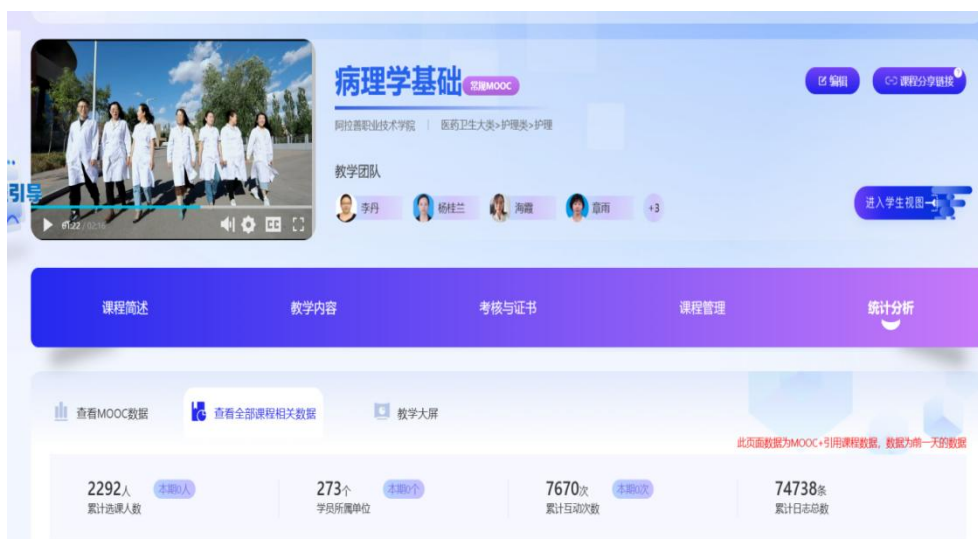
图 2-3 自治区级在线精品课程《病理学基础》

2.2.3.2 教材建设。学院持续完善教材建设与管理机制，严格落实教材四级审核制度，规范教材选用、使用与管理流程。全年顺利完成春、秋两季教材征订与发放工作，累计发放教材 55831 册，“课前到书”率达 100%，有效保障了教学正常开展。在教材体系建设方面，鼓励教师结合专业特色与重点专业群课程开发特色教材，并组织教材编写专题培训 2 场，覆盖教师 150 人次，切实提升教材开发能力。通过联合高教社举办“精品教材进校园”巡展活动，引入国家规划教材、新形态教材六千余种，拓宽选用渠道，促进教材选用质量持续提升。学院积极推进教材信息化建设，加快教材选用平台与教管一体化平台教材管理模块的对接。学年末，已实现“畅想谷——大学教材与数字资源精准服务平台”的试运行，进一步提升教材管理效率与服务精准度。