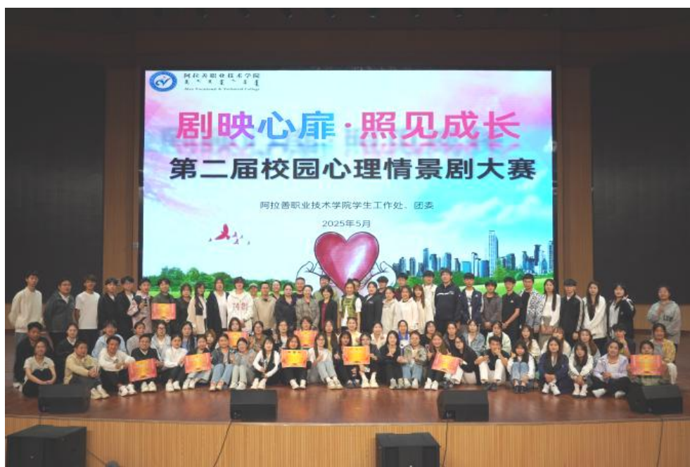
图 2-9 第二届校园心理情景剧大赛

通过四大板块的系统设计，活动成功实现心理健康教育从“被动接受”向“主动参与”的范式转变。以沉浸式体验重塑心理教育形态，以艺术表达开辟情感宣泄通道，以科技手段提升服务效能，以朋辈力量构建支持网络，为高校心理健康工作提供了可复制、可推广的创新实践方案（图 2-9）。