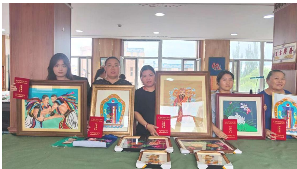
图 3-3 马鬃绕线教学实践基地学员展示马鬃绕线作品

成果已显丰硕：技艺系统推广，学员掌握核心工序，增强文化认同；重点群体通过培训就业创业，改善生活；各民族学员借技艺交流增进团结。未来，基地将深化政企社合作，新增衍生品设计课程与线上培训，拓展服务范围，推动技艺创新与民生改善协同发展（图 3-3）。