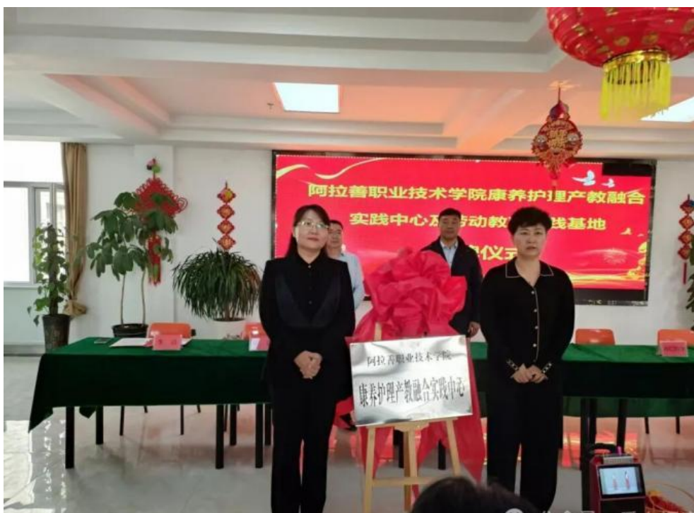
图 6-1 “院校+养老院+医院”产教融合实践中心签约仪式