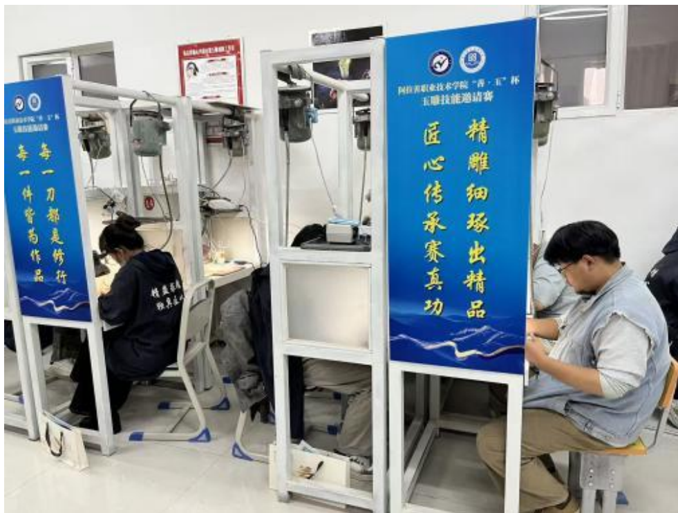
图 2-5 与北京联合举办 “阿拉善善玉杯玉雕技能邀请赛” 比赛现场

2.2.4.3 推进学风建设。 制定《阿拉善职业技术学院课堂教学管理办法》，开展“课堂纪律提升年活动”，加强课堂教学督导和学风建设，强化教学规范组织实施与管理。积极构建党委领导、党政齐抓、部门协同、全院参与的课程思政课建设工作体系，将中华优秀传统文化、革命文化、社会主义先进文化融入专业课程，充分发挥各门课程的思想思想政治教育功能，做到每门课程都能“守好一段渠、种好责任田”。