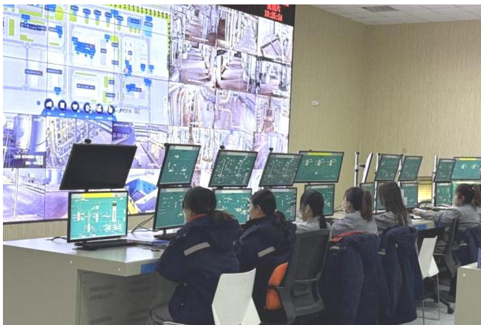
图 6-2 工匠班在企业顶岗实习

经过系统培养，工匠班取得显著成效。学生职业资格证书获取率达 100%，获得自治区职业院校技能大赛奖项 4 项、世界职业院校技能大赛奖项 1 项；兄弟院校联赛奖项 5 项；“一带一路”暨金砖国家技能发展与技术创新大赛全国选拔赛奖项 2 项；毕业生在合作企业开展顶岗实习；为辖区企业输送高素质技术人才 100 余名，有效缓解区域化工产业人才缺口，获得地方政府与行业企业的广泛赞誉（图 6-2）。