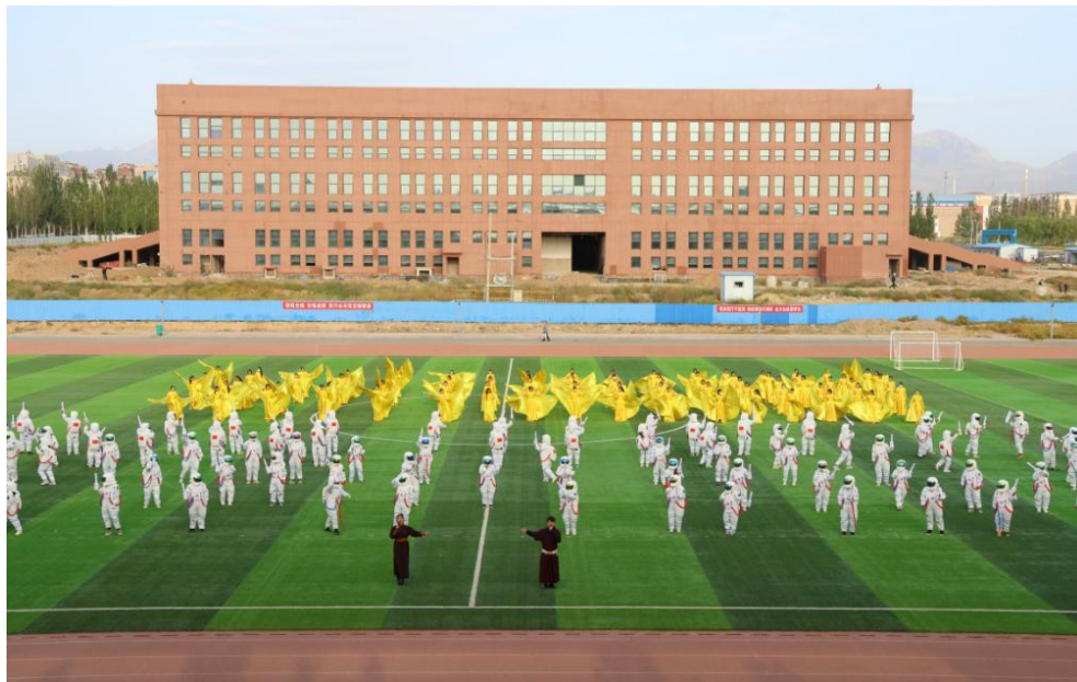
图 4-2 第二届校园文化艺术节开幕式表演

学院深入贯彻落实《新时代公民道德建设实施纲要》《新时代爱国主义教育实施纲要》，结合深入贯彻中央八项规定精神学习教育、“听党话、感党恩、跟党走”群众教育实践等活动等，陆续在全院师生中开展了“阅见北疆 书香阿拉善”、宣讲进校园、朗读者擂主争霸赛等文化活动，以红色经典诵读、理论大讲堂等形式，将社会主义核心价值观、中华优秀传统文化、日常行为习惯养成等与学习生活结合起来，激发师生的爱国之情、报国之志，进一步铸牢师生中华民族共同体意识。充分利用学雷锋日、青年节、护士节等时间节点，大力开展新团员入团仪式、团员承诺签名、劳动教育、校园歌手大赛等活动，从多角度展示青年学子的德智体美劳成果。一年来，累计开展各类活动 50 余场，参与师生 8300 余人次（图 4-2、图 4-3）。