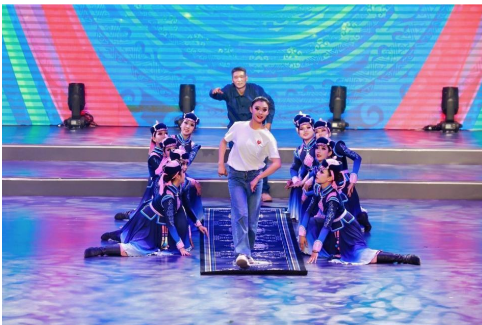
图 4-7 原创民族舞蹈《一路毯途》表演现场

在全盟庆祝“五一”国际劳动节暨全国总工会成立 100 周年职工文艺演出中，由我院工会选送、艺术系编导的原创民族舞蹈《一路毯途》登台亮相，向“百年工运”献上青年学子的赤诚礼赞。作品以我院深耕职业教育、传承非遗技艺的实践为创作根基，将织毯打结、断线等工序提炼为舞蹈语汇，以萨吾尔登的韵律与现代舞队形变换模拟织线流程，让拥有 200 余年历史的阿拉善地毯织造技艺在舞台上焕发新生，诠释了“一带一路”背景下大国工匠精神的传承与创新。舞台上，学生们“以舞叙事”，呈现了我院“非遗工匠班”产教融合育人成果，承载着青年学子对“守正创新”的深刻理解（图 4-7）。