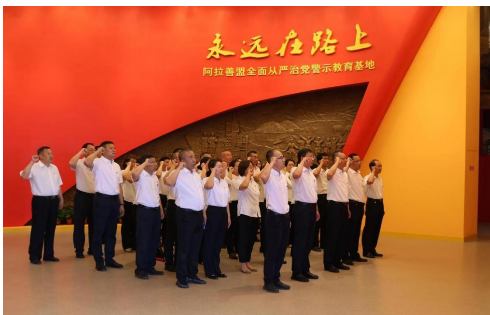
图 7-1 赴阿拉善盟全面从严治党警示教育基地开展主题党日活动

为推进深入贯彻中央八项规定精神学习教育走深走实，以作风建设新成效推动保持党的先进性和纯洁性，阿拉善职业技术学院党委组织院领导、副处级以上干部、科级干部及党员教师代表 110 余人，赴阿拉善盟全面从严治党警示教育基地开展主题党日活动。在警示教育基地，学院党员干部认真听取讲解，仔细观看展板图片、陈列实物、警示案例、廉政箴言及警示教育短片，深入体悟党的百年奋斗历程和自我革命精神，集体重温习近平总书记关于全面从严治党重要论述，系统回顾中国共产党全面从严治党取得的历史性成就，直观了解党风廉政建设和反腐败斗争成果，深刻汲取教育领域及身边违纪违法典型案例教训。党员干部普遍反映深受教育和警醒，深刻认识到全面从严治党永远在路上的丰富内涵和反腐败斗争的严峻复杂性，纪律意识、规矩意识和法治观念得到显著增强，对中央八项规定精神的理解把握更加精准到位。大家表示，必须时刻以案为鉴，常思贪欲之害，常怀律己之心，绷紧廉洁自律这根弦，牢牢守住拒腐防变底线，将学习成果转化为遵规守纪、廉洁从教、推动学院事业高质量发展的实际行动（图 7-1）。