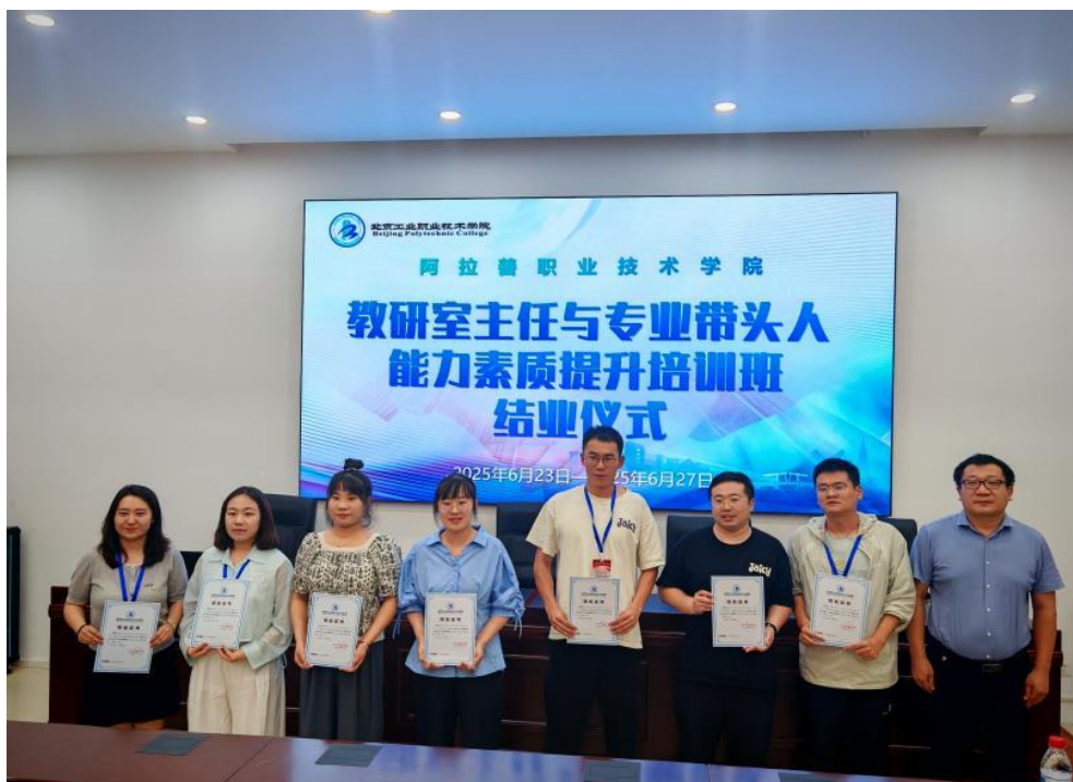
图 5-1 京蒙合作—教研室主任与专业带头人能力素质提升培训班

京蒙合作：赴北京工业职业技术学院开展教研室主任与专业带头人能力素质提升培训班，30余位各专业教学骨干与北工院教师齐聚一堂，以“学院介绍+发展期待”进行深度对话。区域内教师交流：基础部、化工系与乌海职业技术学院等区内兄弟院校开展常态化互访，选派教师赴对方学校观摩学习，借鉴先进教学经验；机电系与内蒙古机电职业技术学院实施“双师型”教师互派培养计划，全年互派教师6人次，开展教学研讨与实训指导4场，有效提升了教师的实践教学能力。跨区域师资协作：信息工程系与暨南大学赵阔教授团队开展为期半年的教学合作，组织15场线上专题培训，涵盖机器学习理论与工业级部署等内容，受益师生200余人，显著增强了师资队伍的专业素养。