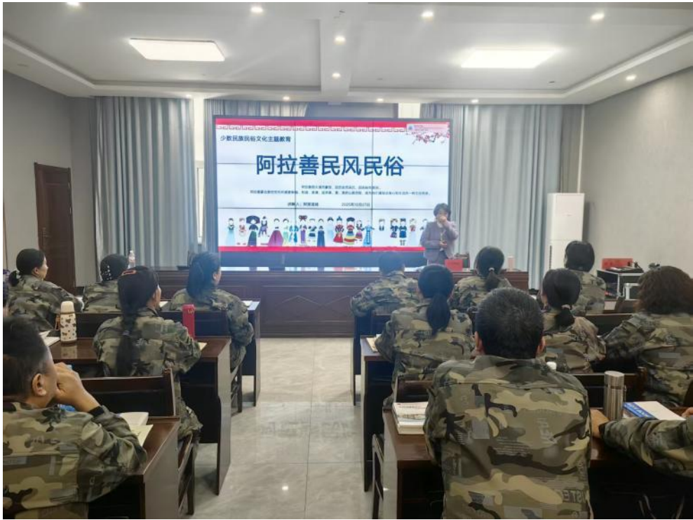
图 3-1 额济纳旗乡土文化能人培训班与民宿管理人专项培训

深耕文旅融合，培育旅游服务人才：依托胡杨林景观与口岸优势，举办 4 期乡土文化能人、民宿管理人培训，共 135 名农牧民参与，课程采用“理论+实践+案例”模式，覆盖民宿运营、文化讲解、新媒体营销等方面，培育“民宿+非遗/研学”复合型人才。聚焦生态保护，筑牢林业人才根基：举办 3 期公益林护林员培训和 1 期森林草原防灭火培训，覆盖 279 人次，围绕森林监测、防火应急、有害生物防控，邀专家开展“理论+实地”教学，提升参训者专业素养。助力“生态美与产业兴”协同发展，赋能农牧群体，推动产业转型升级：开展 11 期高素质农牧民培训，培养各类技能人才 560 人。通过需求调研，邀请专家开设“理论+实操”课程，涵盖种植养殖技术、农产品质量安全，培育“懂技术、善经营、能带动”人才，推动传统农牧业升级。