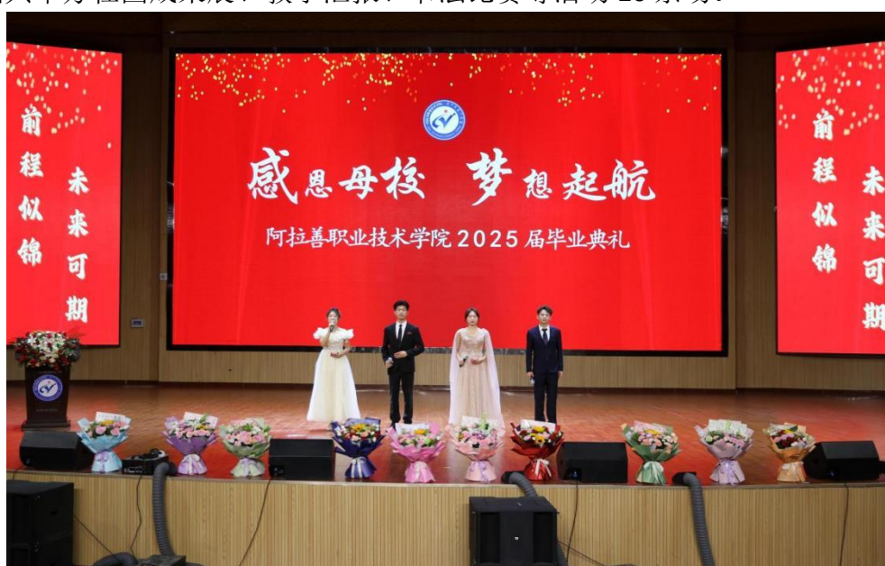
图 2-8 “感恩母校 梦想启航”2025 年毕业典礼

2.3.2.1 校园文化与活动体验。 坚持将繁荣校园文化作为滋养青年成长、服务立德树人目标的重要途径。一是以校园文化艺术节为牵引，打造特色校园文化品牌。联合相关系部开展“融铸北疆 齐心向党”第二届校园文化艺术节，举办第二季“朗读者”擂主争霸赛、“青春筑梦 唱响北疆”十佳校园歌手大赛、“谱写华章 话说未来”首届主持人大赛、“感恩母校 梦想启航”2025 年毕业典礼、青年师生才艺大赛等品牌活动 24 场，持续丰富学生校园文化生活。二是以完善社团管理机制为导向，激发社团活力。召开 2025 年社团工作会议，修订完善社团管理办法，通过“三位一体”社团管理模式和开展社团年审，进一步规范社团运行；通过资源倾斜、为社团教师赋能等方式，激发社团活力全开，截至目前，全院共注册成立社团 50 余个，累计开展社团活动 2600 余课时，各社团共举办社团成果展、教学汇报、书法比赛等活动 20 余场。