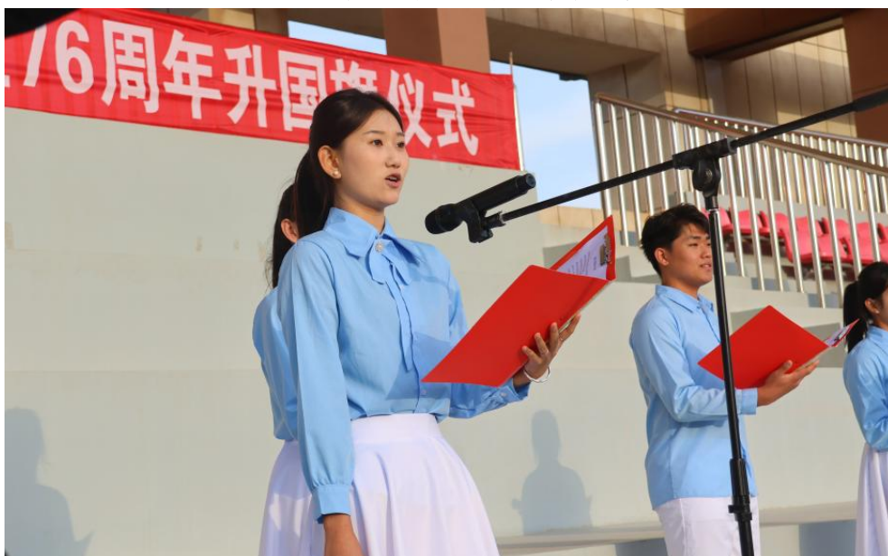
图 4-3 隆重举行“向国旗致敬、向祖国表白”庆祝中华人民共和国成立 76 周年升国旗仪式