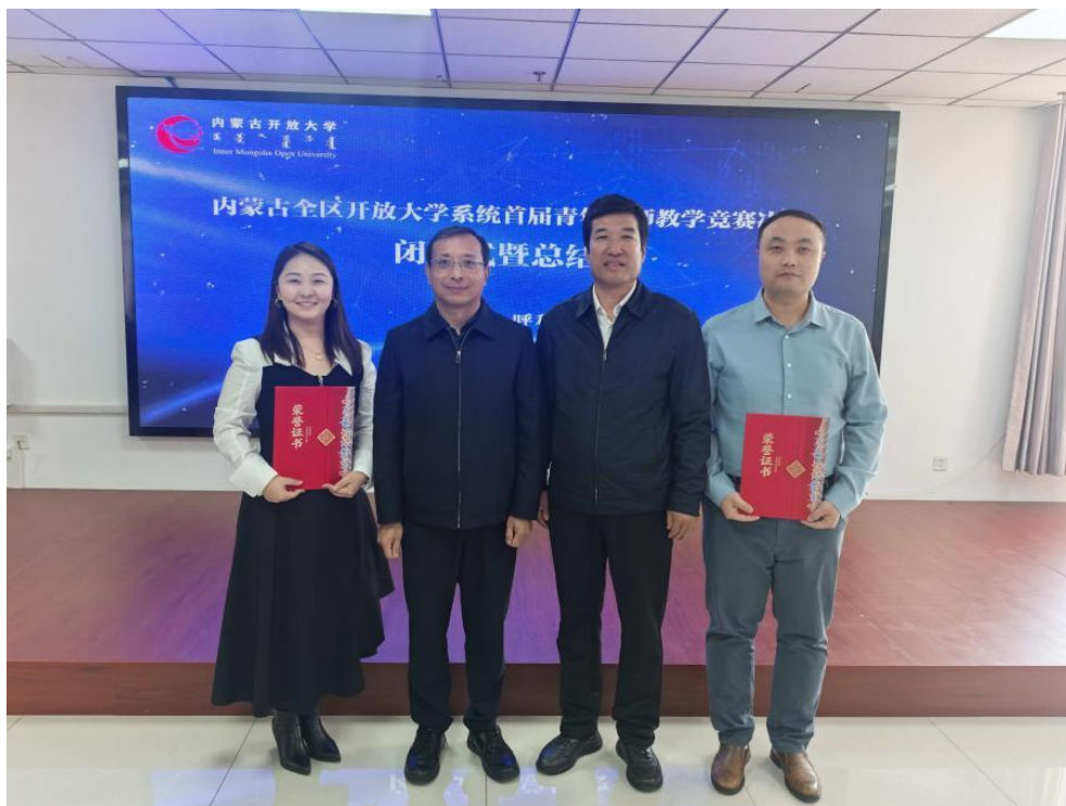
图 3-2 教师在全区开放大学系统首届青年教师教学竞赛上获奖