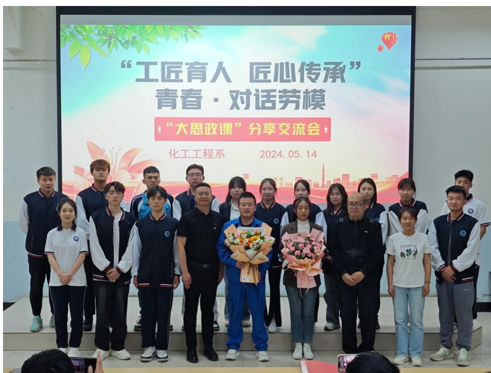
图 4-5 化工工程系“工匠育人 匠心传承”青春对话劳模活动现场

邀请各行业专家学者、北疆工匠、优秀毕业生，采取集中授课、主题宣讲等形式举办各类活动 30 余场，进一步弘扬劳动精神、劳模精神、工匠精神，教育引导广大师生凝聚精神力量，弘扬民族精神。结合各专业特点，发挥实践教学对学生劳动教育的促进作用，通过见习实习、第二课堂等活动，强化实践服务技能、提高职业劳动技能水平，树立服务意识，增强职业荣誉感和责任感，培育学生积极向上的劳动精神和认真负责的劳动态度。