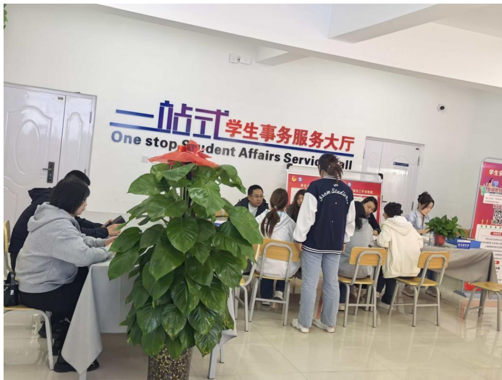
图 2-10 学院新建“一站式”学生事务服务大厅学生办理入学手续场景

念，营造舒适宁静的自然氛围。人文氛围中，师生关系融洽，形成“尊师爱生、互助共进”风气；设立学生会、艺术团等组织，定期开展文体、学术、实践活动，丰富课余生活，拓展综合素质。学院已形成“设施完善、环境优美、氛围浓厚”的校园格局。