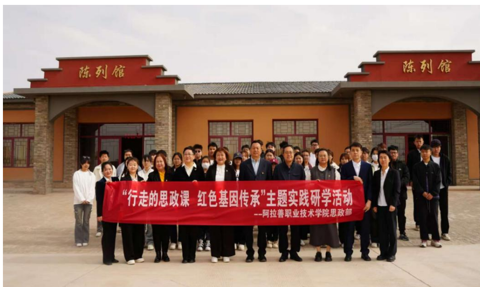
图 2-1 阿拉善红色教育研学基地主题实践活动

为深入贯彻落实习近平新时代中国特色社会主义思想，阿拉善职业技术学院立足地方特色，统筹建设了四大思政实践基地，分别为：阿拉善军分区航天蓝思政实践基地、阿拉善生态沙产业创新创业园、阿拉善红色教育研学基地、额济纳旗博物馆，构建起覆盖红色基因、航天精神、生态治理等多维内容的实践育人平台。学院同步建成“铸牢中华民族共同体思政资源库”，计划于 2026 年全面投入教学与实践使用，进一步拓展思政育人载体，推动思政教育从课堂向实景深度延伸。在实践教学组织过程中，注重理论讲解与实地体验相结合，强化学生对红色文化、航天精神和生态治理的理解与认同。2025 年，累计组织实践教学实践活动覆盖学生 800 余人次，学生思政素养测评优良率由 85% 提升至 92%，实践育人成效持续显现。学院依托阿拉善红色教育研学基地开展“秘密交通线”实景研学，引导学生感悟初心使命；在航天蓝思政实践基地组织“逐梦苍穹”主题实践，结合航天任务背景厚植科技报国情怀；依托生态沙产业创新创业园推动绿色发展理念融入教学，展现各族儿女共建家园的生动实践；额济纳旗博物馆则成为深化“五个认同”教育的重要平台。未来，随着思政资源库的投入使用，学院将持续优化“基地+资源库”双轮驱动的育人机制，为同类院校提供可复制、可推广的实践育人经验（图 2-1）。