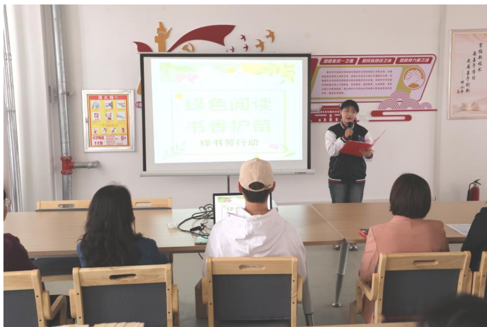
【案例 4-1】坚持立德树人 谱写文化自信底色

充分运用“学习强国”“驼乡 e 站”、官网官微、OA 办公系统等线上平台,通过理论学习中心组学习、“三会一课”、主题党团日等活动,积极开展好书分享会、红色经典诵读、“阅见北疆 书香阿拉善”评比等各类读书活动,进一步发挥宣传主渠道、文化主阵地作用,不断引导青年学生坚定理想信念、练就过硬本领、担当时代责任。今年累计发布相关信息 29 篇,阅读量超 6000 余人次。