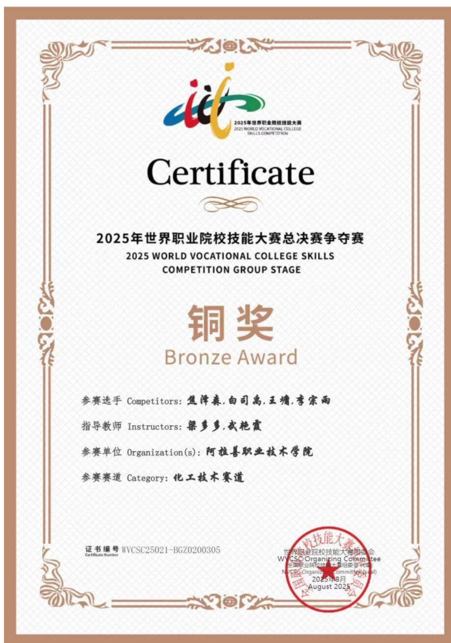
图 2-12 学生参加 2025 年世赛化工技术赛道获得铜奖获奖证书

举办“青春·对话劳模”活动。邀请自治区技术能手、“五一劳动奖章”获得者张海东、优秀校友张芬林分享优秀事迹，覆盖师生 500 余人次；学生感言“向劳模学习、向优秀学长学习，以劳模精神、劳动精神、工匠精神作为人生的坐标，刻苦学习专业知识、苦练专业技能，不断磨炼意志、提高自己，努力成为一名合格的化工专业技能人才。”