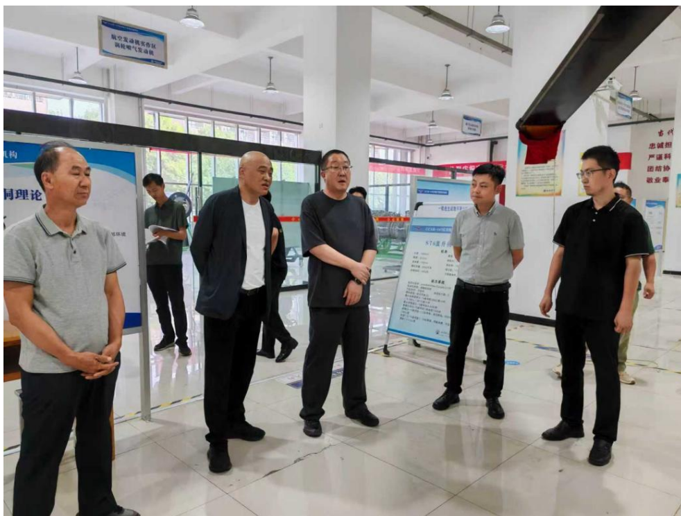
图 2-7 学院党委书记带队到长城汽车股份有限公司访企拓岗

2.3.1.2.1 深化校企联动拓展就业渠道。 学院坚持将就业工作作为“一把手”工程，院系联动开展 12 轮“访企拓岗促就业”行动，走访用人单位 396 家，新增优质岗位 2100 余个，较 2024 年增长 35%，重点覆盖区域产业链及盟旗优质单位；同时深化政企校合作，与阿拉善盟及周边人社局、产业园区建立岗位共享机制，每学期组织毕业生参加地方大型招聘会 3 场、行业专场 2 场、推介活动 4 次，并拓展跨区域就业渠道，与区内外重点城市人才市场联动。依托内蒙古大学生就业服务平台，构建“线上+线下”“综合+专场”招聘体系，全年举办线上大型招聘会 1 场、线下大型招聘会 3 场、校园专场 9 场、企业宣讲会 10 场，累计提供岗位 2790 个，岗位与毕业生人数比达 2.13:1，针对低就业率专业实施“专场招聘”，精准推送岗位促成签约率提升。