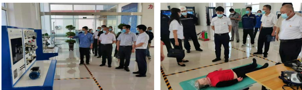
图为学院领导和主管部门领导参观腾格里职业培训基地

2022 年上半年，学院进一步改进校企双方合作方式，将职业培训利润分配向企业倾斜，调动企业对职业培训基地资金投入的积极性。已将建在内蒙古莱科作物保护有限公司院内的“校企合作”的腾格里职业培训基地搬迁到阿拉善左旗腾格里额里斯镇，使学院腾格里职业培训基地符合疫情防控要求，更好地满足对社会提供职业培训的需求。